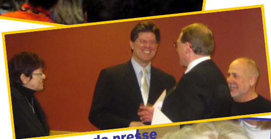
Conférence de presse