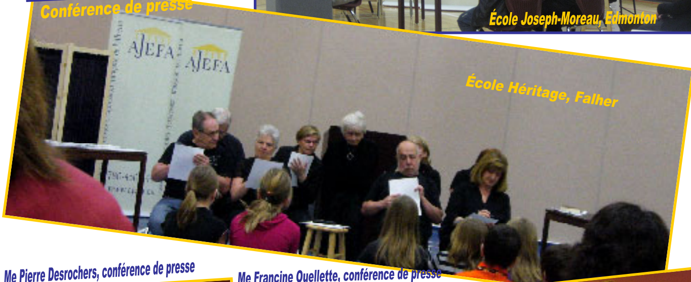
École Héritage, Falher