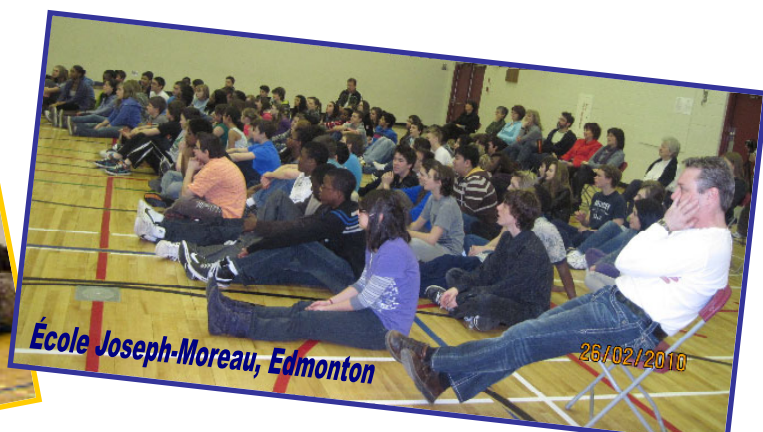
École Joseph-Moreau, Edmonton