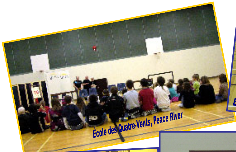
École des Quatre-Vents, Peace River