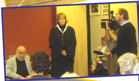
Conférence de presse