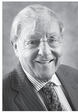
Roy McMurtry

(1975-1985), il a été l'un des architectes de l'entente qui a conduit au rapatriement de la Constitution canadienne; haut-commissaire du Canada auprès du Royaume-Uni, puis juge en chef de l'Ontario, Roy McMurtry a fait une contribution inestimable à la vie politique et au système juridique du pays.